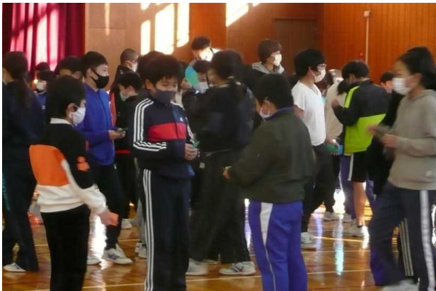
▲なかよしタイム「ありがとうジャンケン」 レクを通して全校で交流しました。