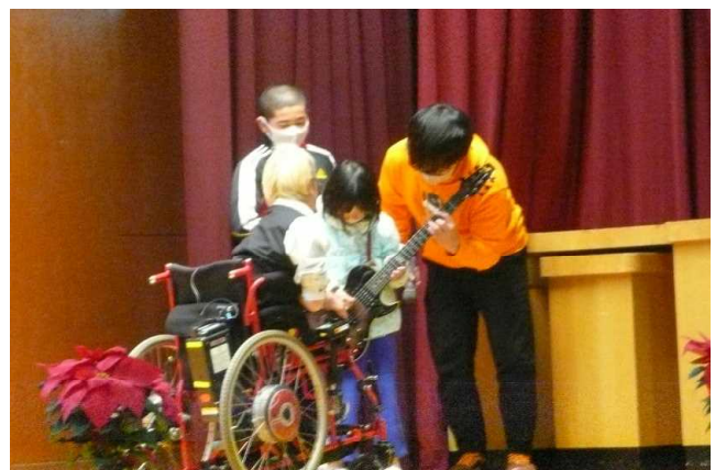
▲代表の2人が ギターを弾かせてもらいました。