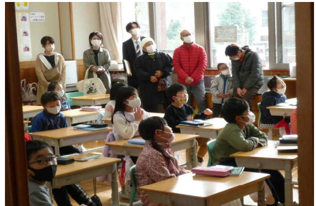
▲地域参観日 11月20日（土） 人権教育にかかわる学習をしました。