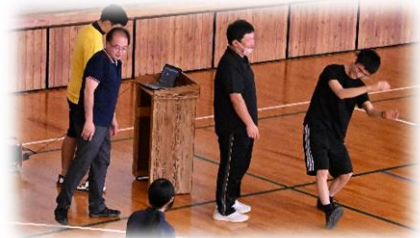
先生方もノリノリ？