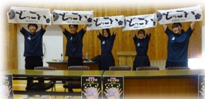
中心になって進めてくれた文化祭実行委員会のみなさん