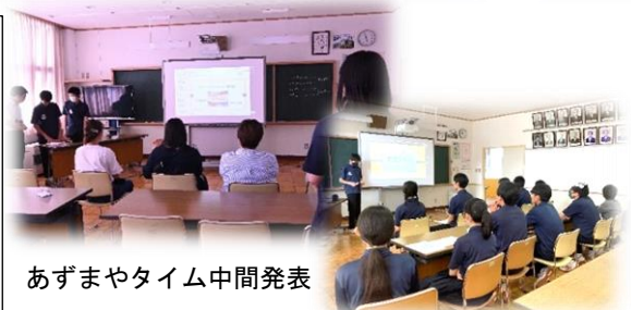
あずまやタイム中間発表