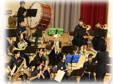
第 1 部 吹奏楽部