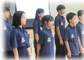
第 2 部 合唱