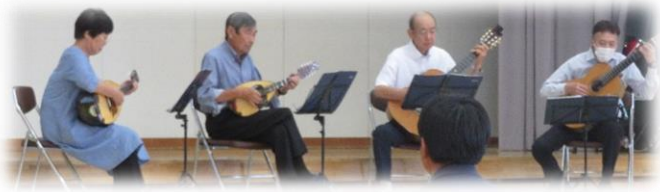
筑北マンドリン・ギタークラブのみなさん