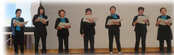
コール筑北のみなさん