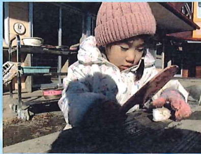
「こうするんだよ」 反対の手で氷を掴むと切りやすい