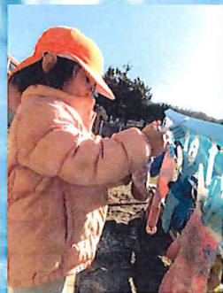
濡れた手袋は 「自分で干したい」

寒さに負けず雪に触れて、料理にしてたくさん遊んでいた子ども達です。遊びの中にも「自分でやりたい」「どうしたらできるかな」と考えたり挑戦したりする姿がいっぱいです！遊びを通して成長していますね😊