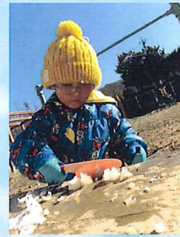
「やわらかい」 水で濡らすと簡単に切れるよ