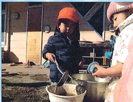
雪のスープもおいしそう