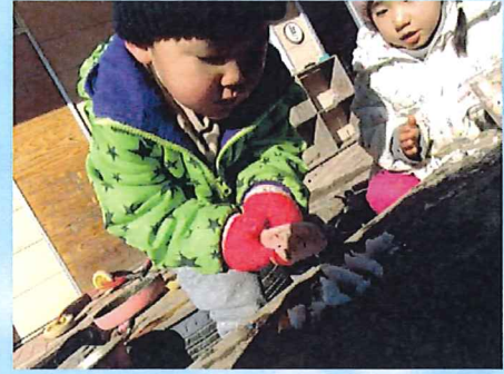
包丁で切りたい 「かたいな」