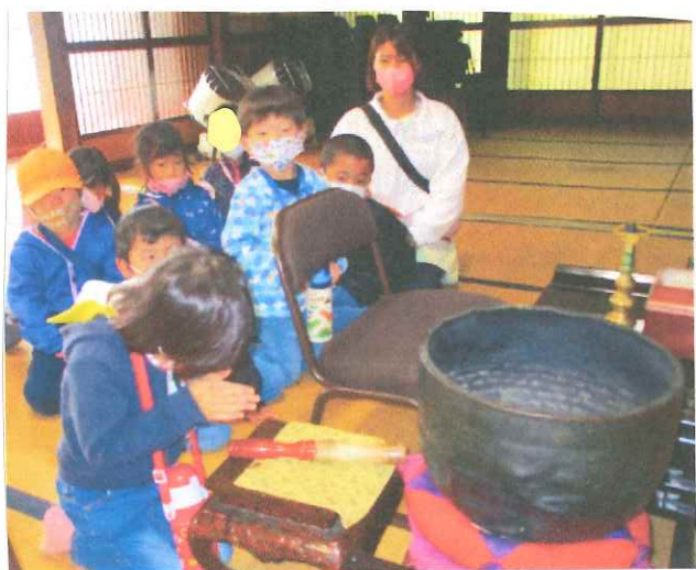
安養寺で 大人お願いをとりました!