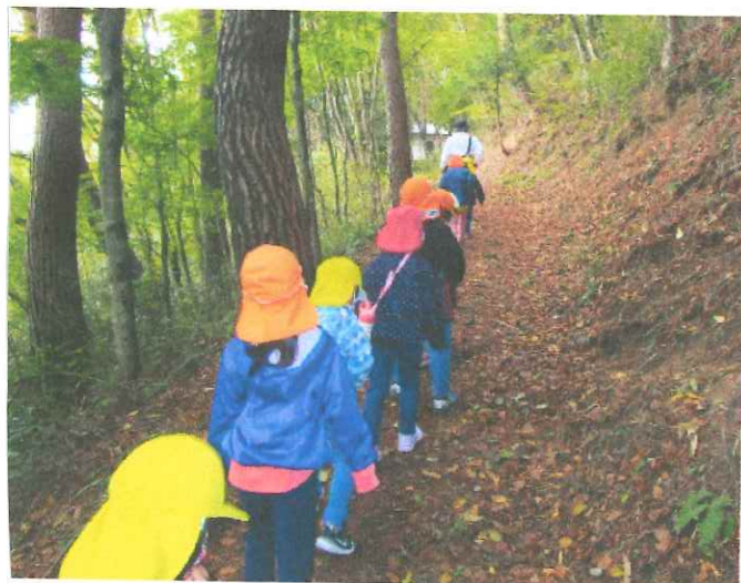
山道を一生けん命歩いていきました!! (安養寺から 冠着島尺環下したバ あしとバ (おまいた))