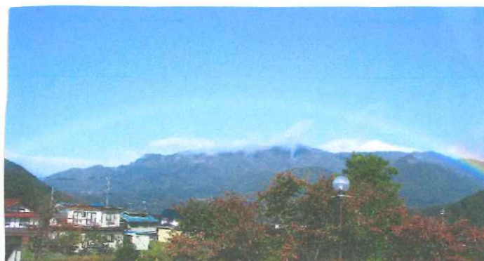
朝から雨... でも保育園から大きりにじバ見えました!!