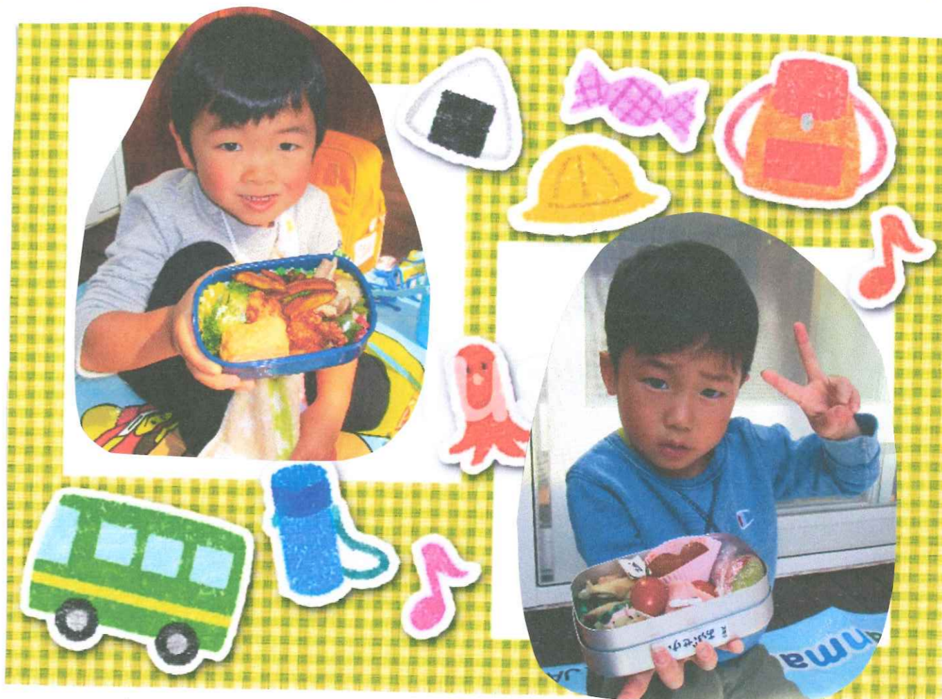
おつかさん、お弁当 ありがとう!!

「おしかった!!」「ありがとう」って言う!と 感謝の気持ちか 育っている ちやうど 3歳児さんです。