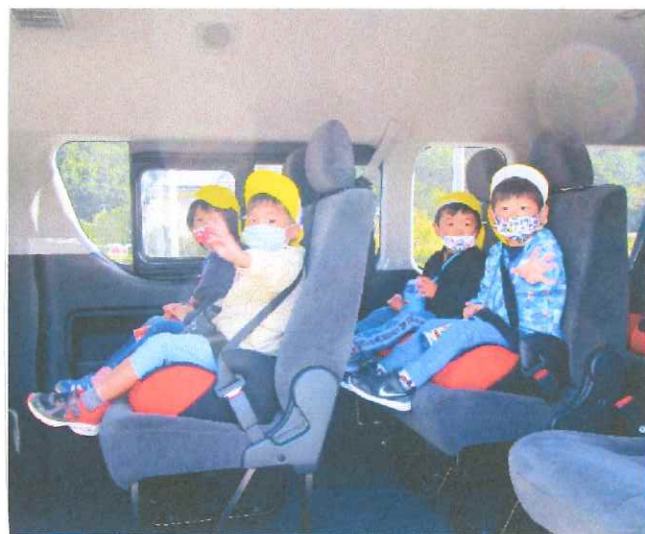
ハイエースにて出発 (人:うー!!)