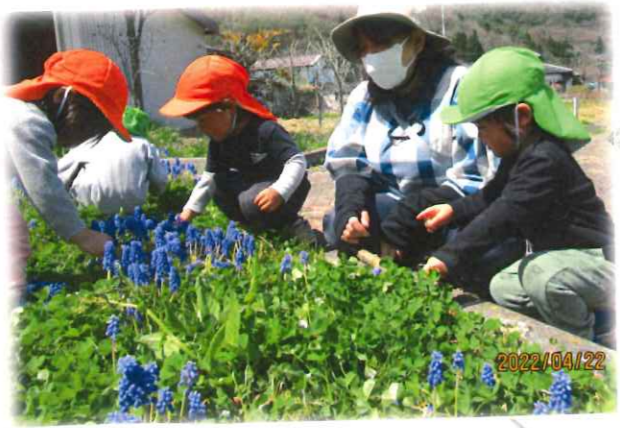
ぶどうみたく 色を混ぜて...