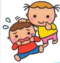
友達との かかわり