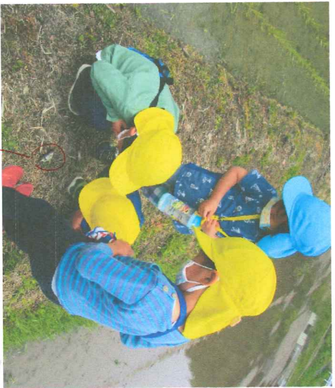
＜ 死んだ蛙、なぜ死んだかを見よう！ ＞