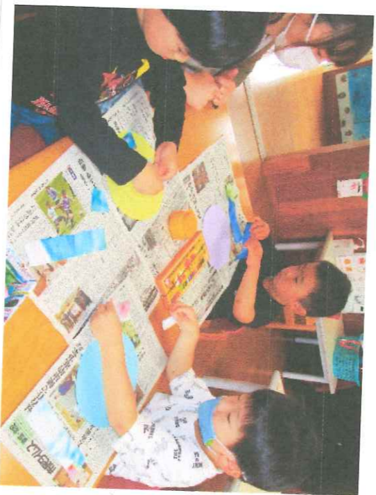
＜ カエルとカタツムリ 作りかたをしよう! ＞