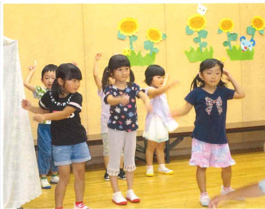
< 一斉に遊ぶ姿、体操、かたまりをしながら、あやう緊張して、少しづつ一斉に遊ぶ姿も見られました >