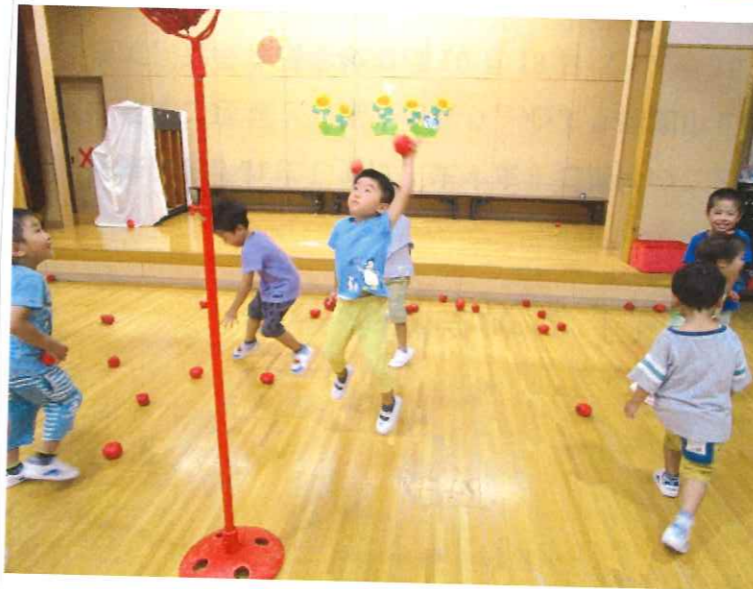
< Hクラスで玉入れゲームをしました >