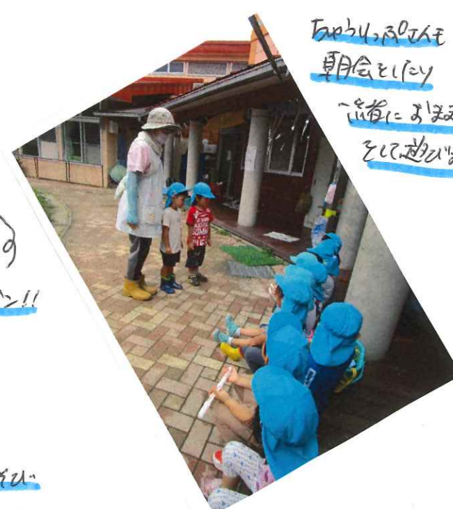
あやうのり 朝会をいっ 一斉に遊ぶ姿 をたくさん見ました