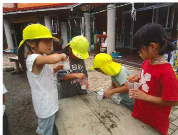
あやうのり ヨーイドン！！ あやうのり Fクラス