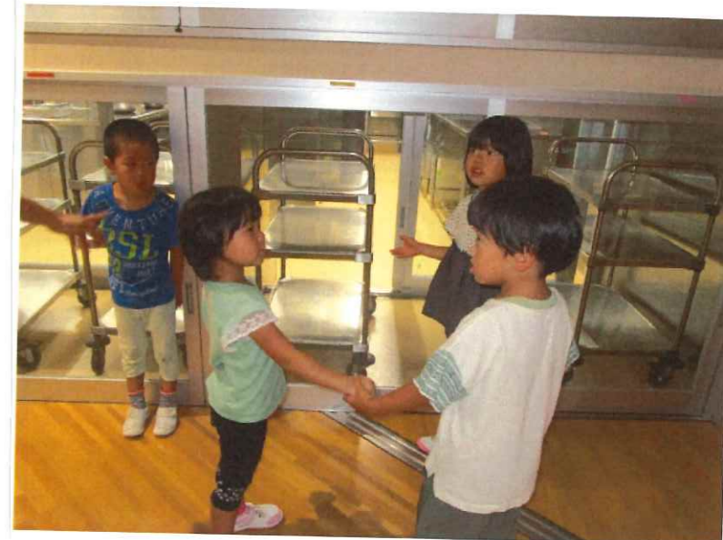
< 保育園の中を案内してもらいました >

大勢のお友だちと、とまどう姿も見られまして、 少しづつ関わりあう中から、一斉に遊ぶ姿が見られ た。経験を通して、Fクラスの友だちと関わり あう姿、おもしろいと感じてほしいですね。 子どもたちの関わりあう姿を表現を大切に これから交流をしていきたいと思います！！