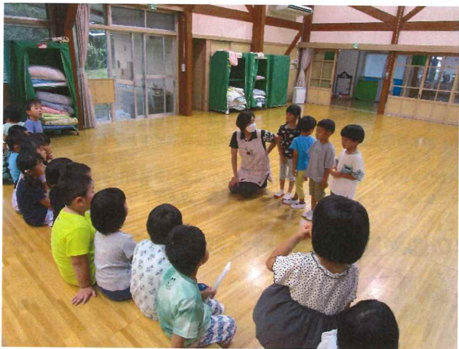
< FクラスとHクラスで、あやうのりお部屋で自己紹介や朝会をしました >