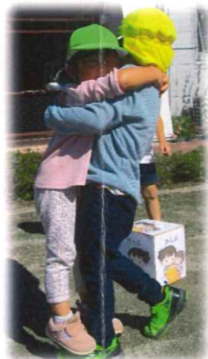
だっこ、おんぶ うれしいなあ!