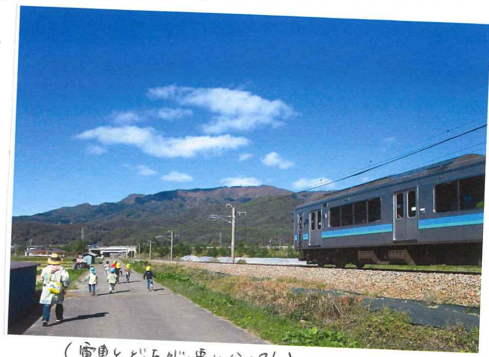
(電車とどっちが速いかな?)

「電車と競争したい」と全力で走り子どもたち。体力もつて力強く走る姿は頼もしいと感じました!!