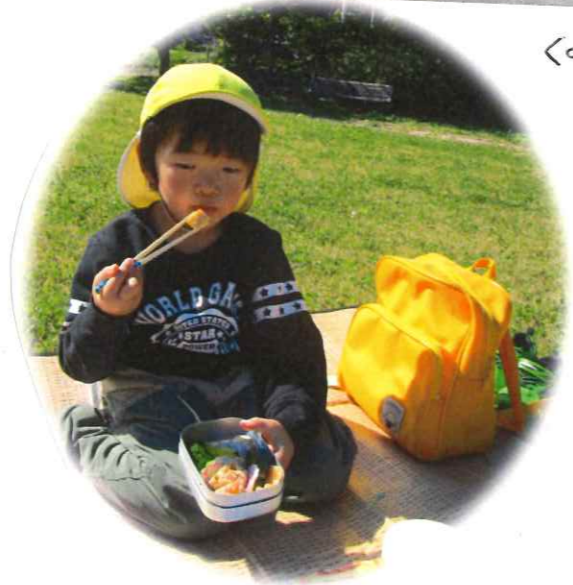
<みんなはよ〜いぞろぞろ!!>

風の音、虫のこえ、車や電車の音、自然の中で、みんなのこえに気がついて、思いやりあふれる子どもたちです。そしてお母さんの愛情を感じながらお弁当をおいしく食べました♡