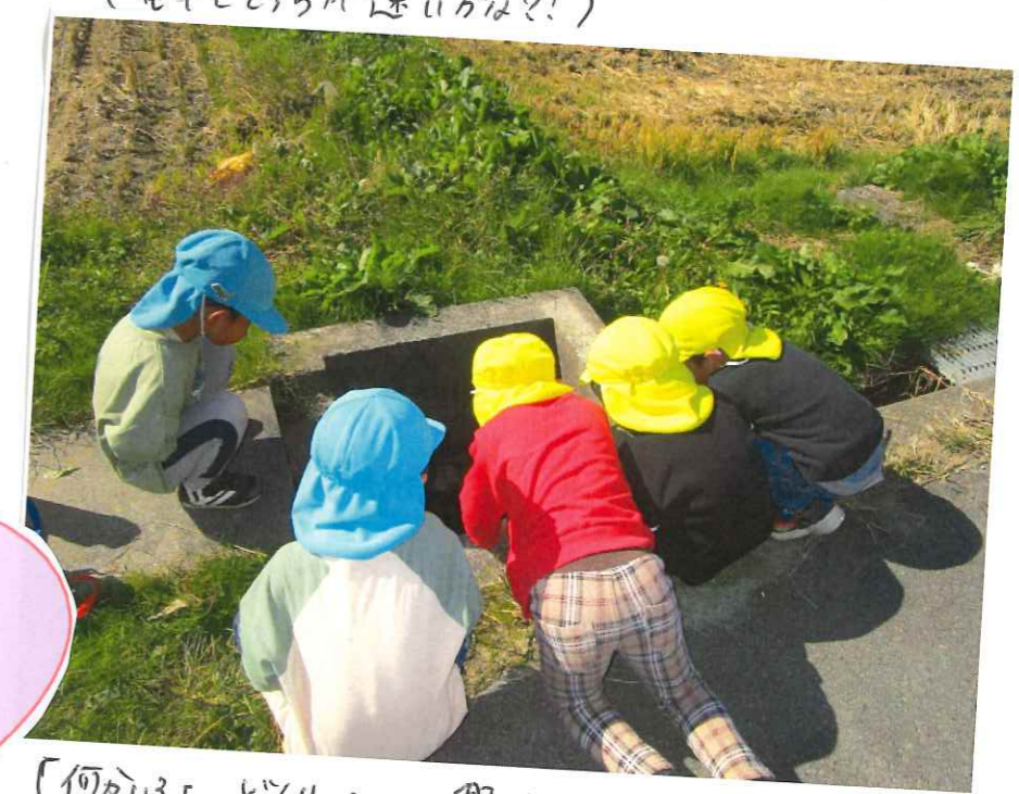
(何かいさよ じや〜と興味いっぴいの子どもたち)