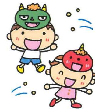
大変！前日にパンツを忘れてしまった 鬼がやってきてしまった！？