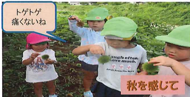
トゲトゲ痛くないね