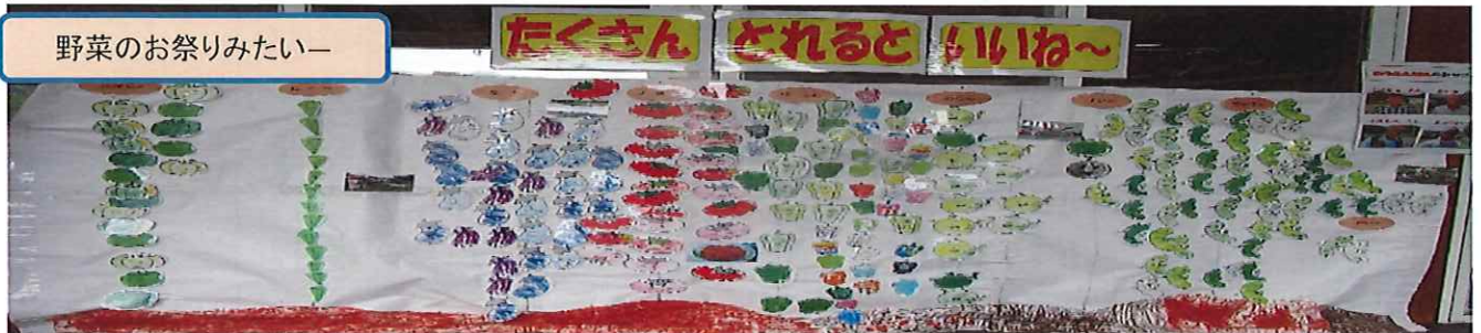
野菜のお祭りみたいー