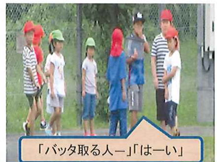
「バッタ取る人ー」「はーい」

暑さが和らぎ始め散歩にも出ています。地域の方に会い、いろいろな話をしたり小学校では一緒に遊んでもらったりして楽しそうでした。みんなとつながっていることを感じてうれしくなりました。秋も楽しみです。