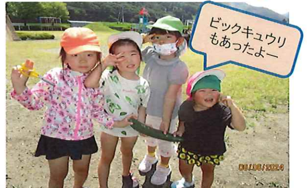
ビックキュウリもあったよー