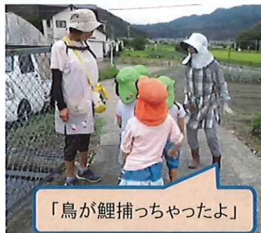
「鳥が鯉捕っちゃったよ」