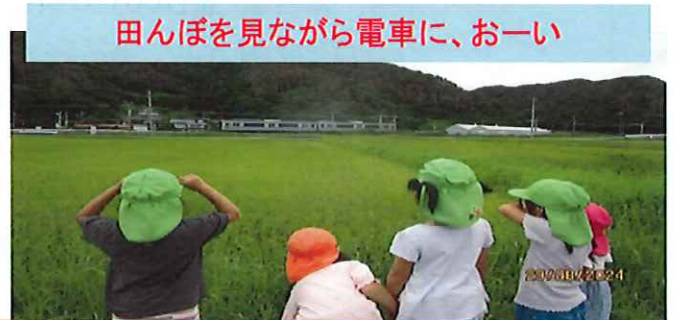
田んぼを見ながら電車で、おーい

収穫の嬉しさを感じてほしい。そんな思いが繋がって、地域の方のご協力により毎日山盛りの野菜を採り、味わう嬉しさを経験しています。「すごいね」「おみやげ嬉しい」とお家の方も収穫と一緒に喜んでくださり「家でも食べたよ」と報告してくれる声も届いています。自慢の畑になっています。ありがとうございます。園の周辺では実った栗に気付き触ってみたり、田んぼの稲が黄色くなりお米がついているのを観察したり、季節の変化も感じて過ごしている子どもたちです。