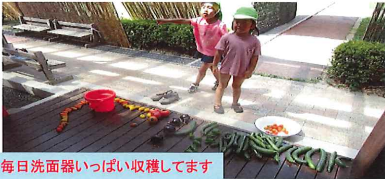
毎日洗面器いっぱい収穫してます